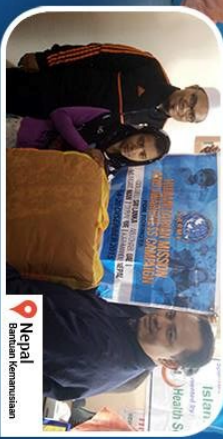
Nepal Bantuan Kemasyarakatan